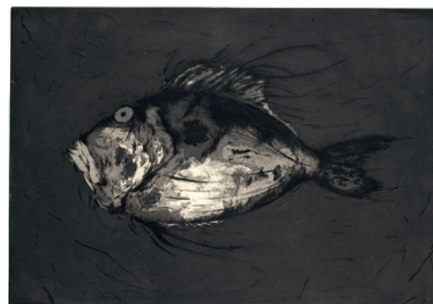
Marjan Seyedin, Poisson 4 , eau-forte, aquatinte et pointe-sèche, 2018. © Marjan Seyedin.

Marjan Seyedin, gravures et dessins (2006-2018) , jusqu'au 13 octobre 2018, galerie Documents 15, 15, rue de l'Échaudé, 75006 Paris. Du mardi au vendredi de 13h à 19h, le samedi de 12h à 19h. Tél. : 01 46 34 38 61, site Internet : galeriedocuments15.com