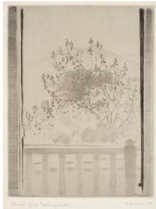
BALKONGUTSIKT (VUE DU BALCON)