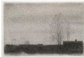
KVÄLL LANDSKAP (PAYSAGE DU SOIR)