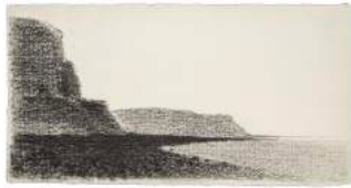
FORT VID HAVET (FORT AU BORD DE LA MER)