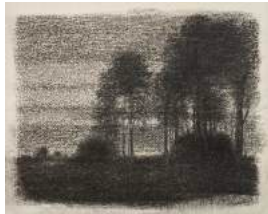
NATT I BERGEN (NUIT DANS LA MONTAGNE)